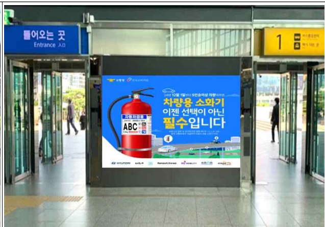
공항철도 출입구 송출 예상 이미지