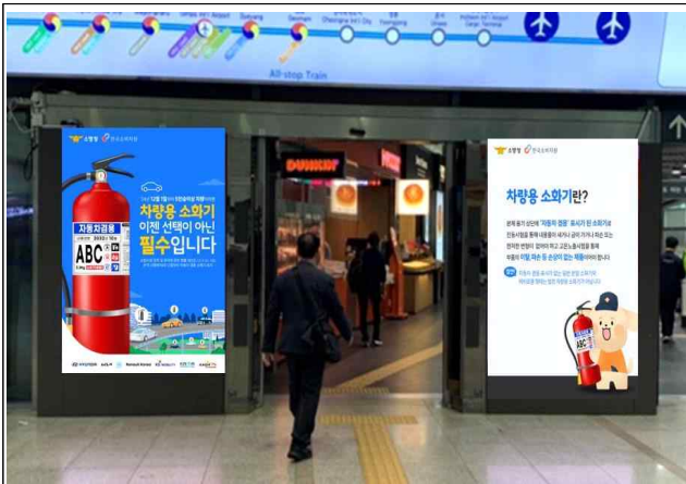
서울역 1번 출입구 송출 예상 이미지