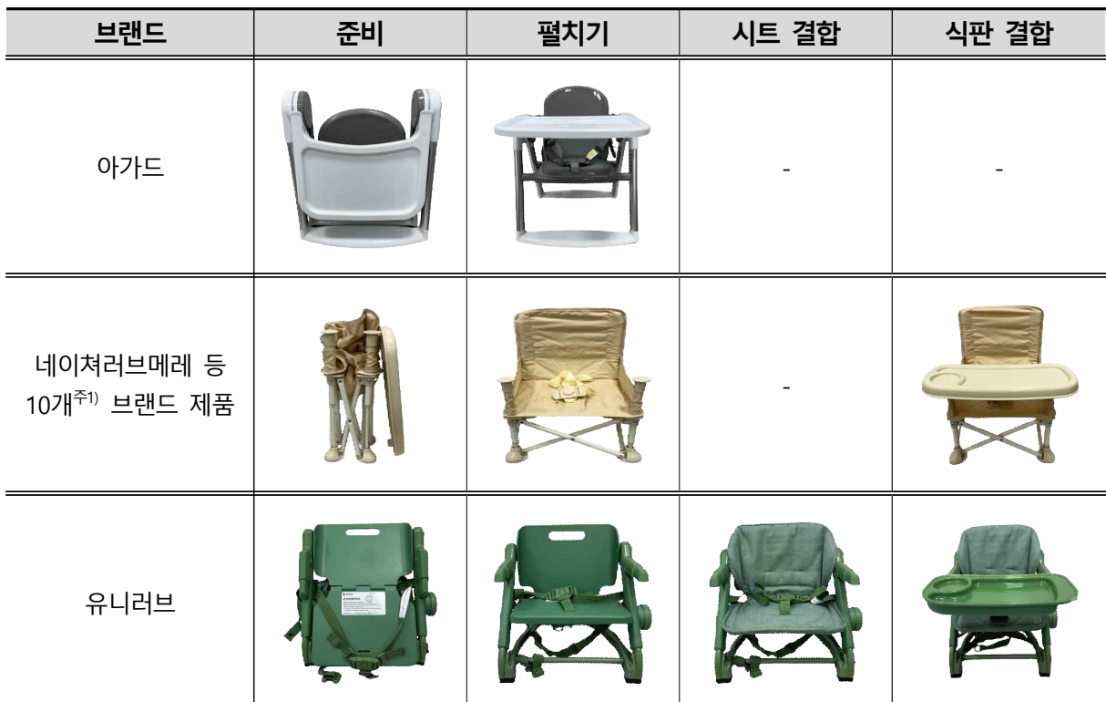
[ 설치편리성 예시 ]

주1) 네이처러브메레, 디자인스킨, 모던홀릭, 몽나, 보스꼬, 엔픽스, 이유베이비, 키저스, 피에고, 후