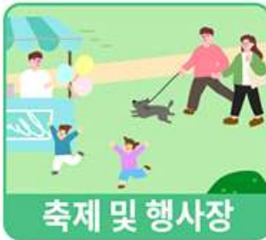
축제 및 행사장